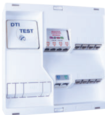
Coffret principal format 250x250