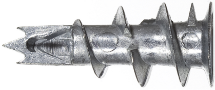
Fixation métallique pour carton-plâtre GKM